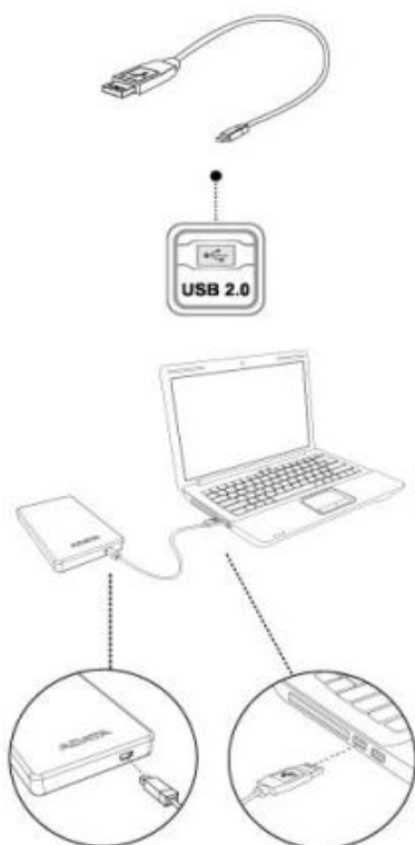
Kabel USB 2.0