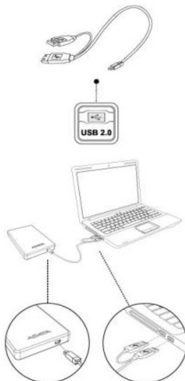
Kabel Y-USB 2.0